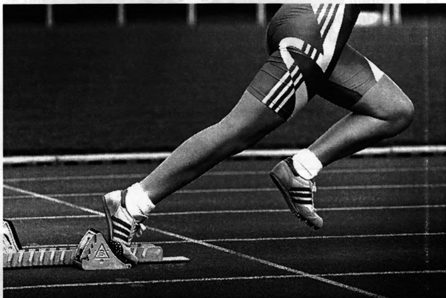
Gestaltung: Gottschall, Benz & Partner, Worms

Wer sich im sportlichen Wettkampf misst, wer gewinnen will und dafür regelmäßig trainiert, der kennt das prickelnde Gefühl, bevor der Startschuss fällt.