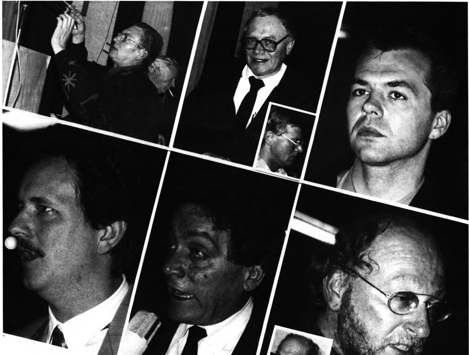
für Montag, 11. Mai, neu angesetzt.