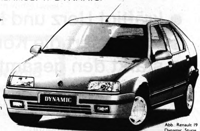
Abb.: Renault 19 Dynamic, Stung

MEIN ENDPREIS FÜR DEN: R 19 GTS 3türig DM 21.200,-