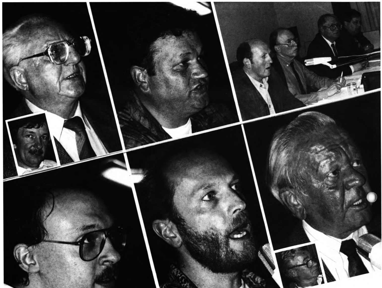
Wormatias Jahreshauptversammlung wurde