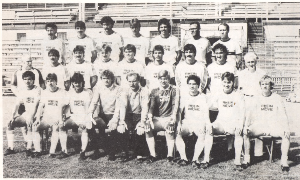
Wormatia Worms — Oberligakader 1986/87